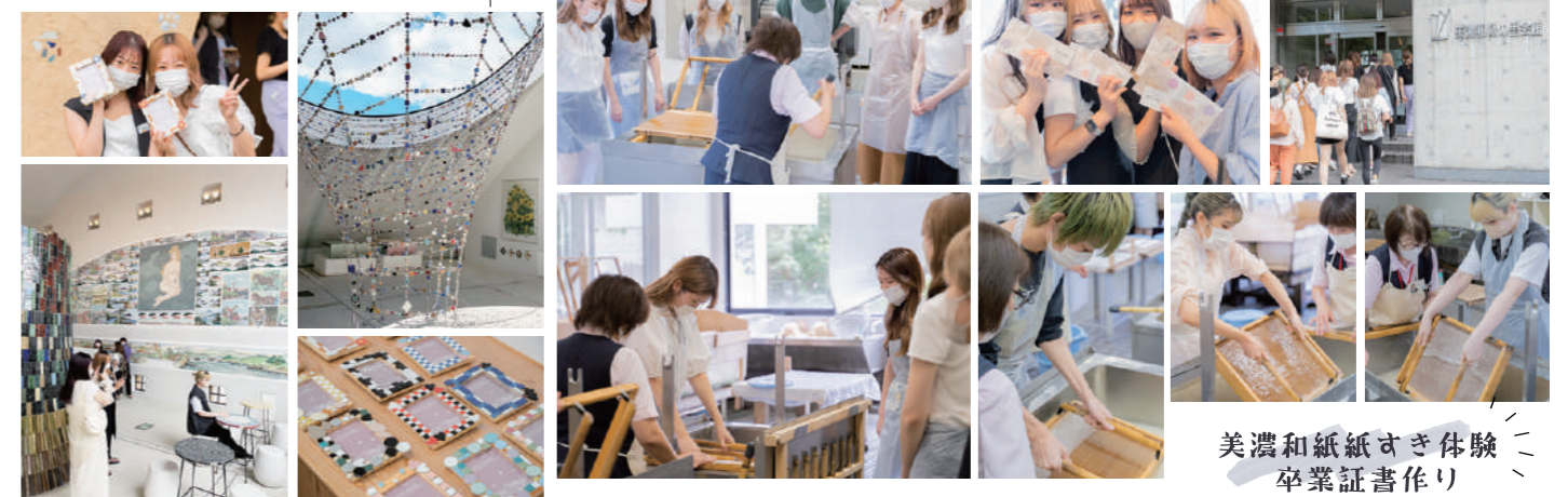
美濃和紙紙すき体験 卒業証書作り