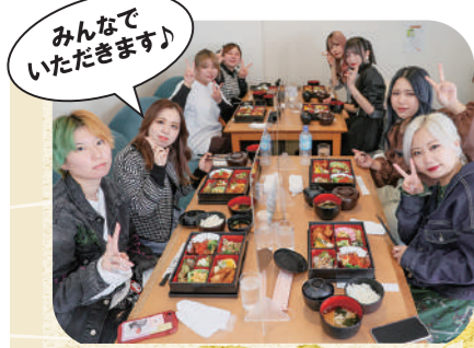
みんなでいただきます♪