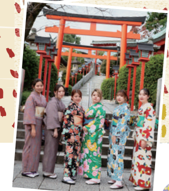
コロナ禍で色々イベント等も控えてきた中で、日々の生活の思い出の一日になったのではないのでしょうか。