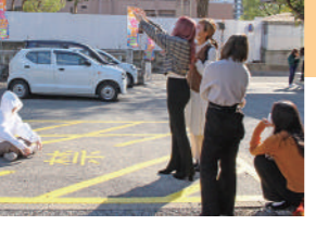
学んだテクニックを将来の作品撮影に活かせるよう、写真を撮るとき、意識してゆきましよう。