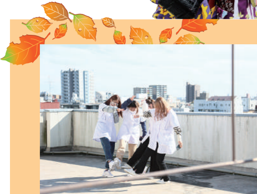
どうやって撮ろう...