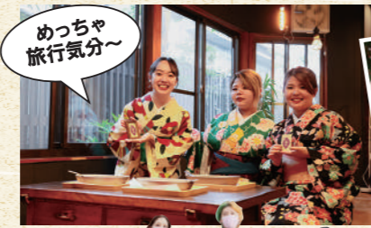
めっちゃ旅行気分~